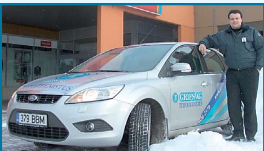
Estijoje greito reagavimo ekipažų automobiliai be švyturėlių – draudžiami įstatymu. Bet tai netrukdo teikti kokybiškas paslaugas.

„Lotsi“ – tai prekybos centras, įsikūręs Talino jūrų uosto keleivinio terminalo teritorijoje. Jame didžiausi alkoholio pardavimai ir, aišku, su tuo susijusi problematikabėdaugiausiai sulaikomų asmenų ir neblaivių užsieniečių – taigi Jums linkėjimus siunčia profesionali ir kovose užgrūdinta komanda.