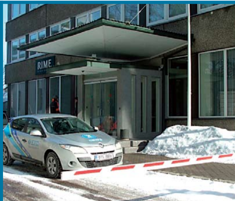
Estijos centrinė būstinė adresu: Tatari 64, 10134 Tallin, Estonia. Tel. 372 648 8020.