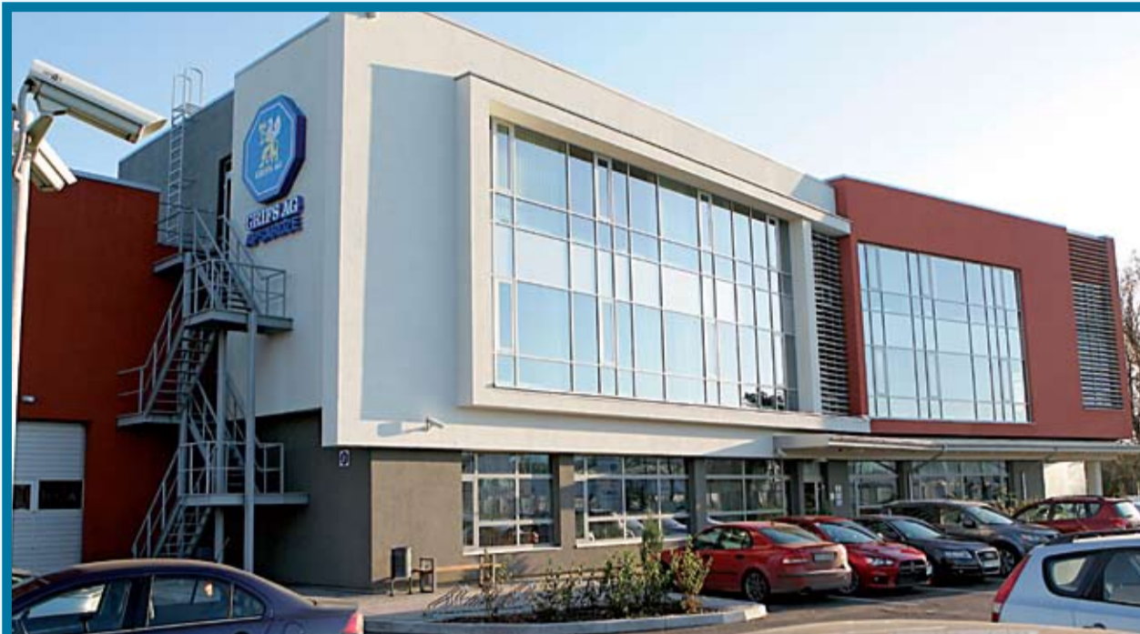
Latvijos centrinis biuras: Ulbrokas iela 42G, LV 1021, Latvija. Tel +371 678 13 710.