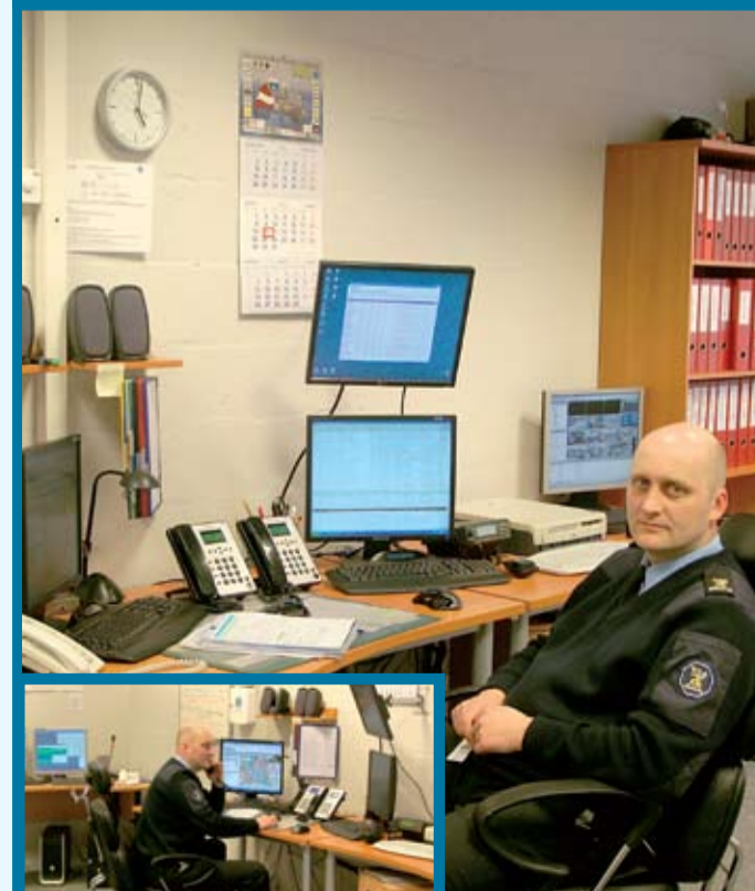
Latvijos CSP įrengtas pagrindiniame biure.